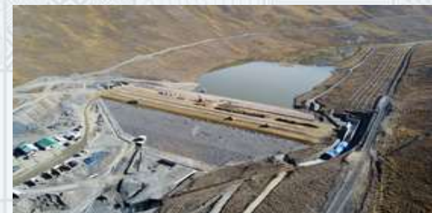
CONST. PRESA TERACOLLO