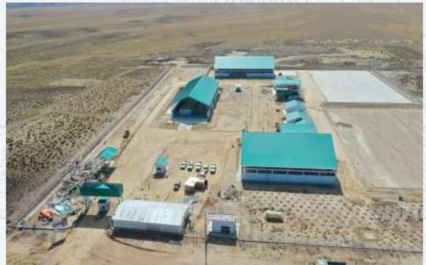
DISEÑO Y CONSTRUCCIÓN DEL COMPLEJO DE APROVECHAMIENTO DE RESIDUOS SÓLIDOS URBANOS PARA EL PROYECTO: "IMPLEMENTACIÓN GESTIÓN INTEGRAL DE LOS RESIDUOS EL ALTO"