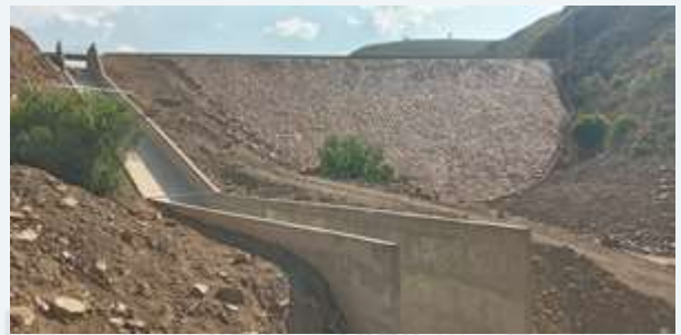
CONST. SISTEMA DE RIEGO RAQAYPAMPA