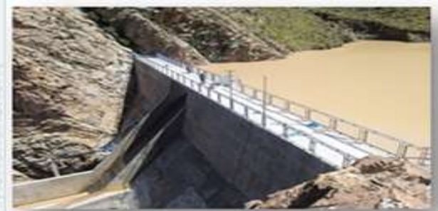
CONST. PRESA Y SISTEMA DE MICRO RIEGO KULLCU