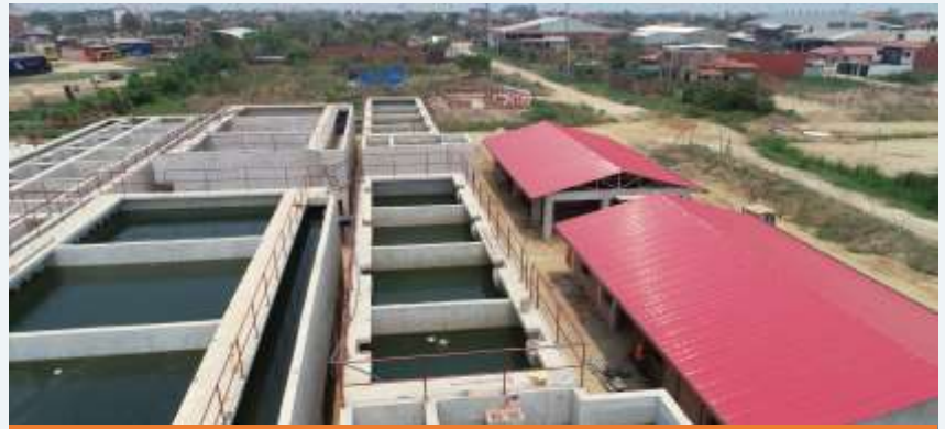
CONSTRUCCIÓN SISTEMA DE AGUA POTABLE (SAP) TRINIDAD - BENI - BOLIVIA