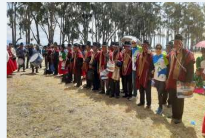
PLAN DIRECTOR DE LA CUENCA DEL RIO KATARI