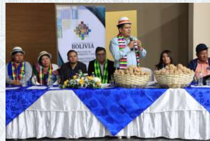
PLAN DIRECTOR DE LA CUENCA DEL RIO CACHIMAYU