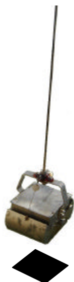
Draga tipo Ekman, muestreador del bentos en la zona profunda de ambientes lénticos (Lagos)