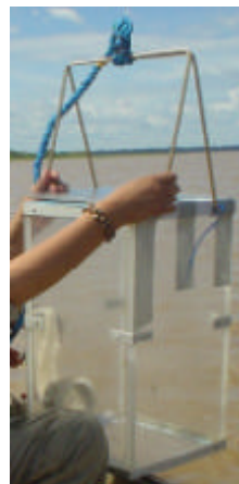
Red de muestreo del fitoplancton Caja de Schindler patalas para el muestreo de zooplancton