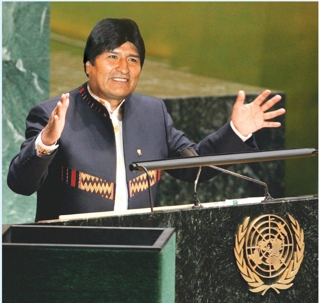
Presidente Evo Morales Ayma en la Cumbre de la ONU sobre Cambio Climático en Poznań, Polonia

La competencia y la sed de ganancia sin límites del sistema capitalista están destrozando el planeta. Para el capitalismo no somos seres humanos, sino consumidores. Para el capitalismo no existe la Madre Tierra, sino las materias primas. El capitalismo es la fuente de las asimetrías y desequilibrios en el mundo. Genera lujo, ostentación y derroche para unos pocos mientras millones mueren de hambre en el mundo. En manos del capitalismo todo se convierte en mercancía: el agua, la tierra, el genoma humano, las culturas ancestrales, la justicia, la ética, la muerte... la vida misma. Todo, absolutamente todo, se