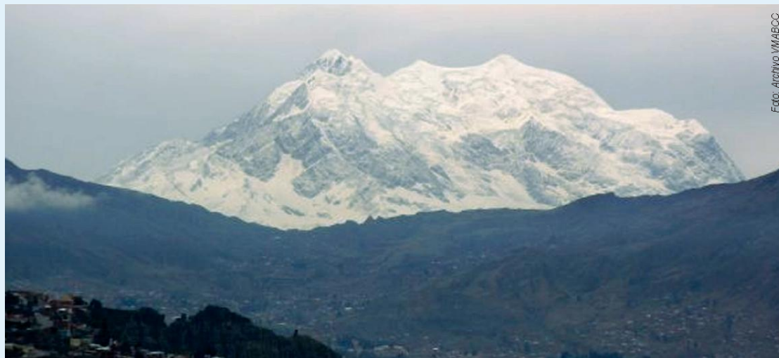
Illimani, La Paz

voluntarias y obligatorias para que todos los países puedan acceder a los productos ya patentados en forma rápida y libres de costo. Los países desarrollados no pueden tratar las patentes o derechos de propiedad intelectual como si fueran algo "sagrado" que tiene que ser mantenido a cualquier costo. El régimen de flexibilidad que existe para los derechos de propiedad intelectual, cuando se trata de graves problemas a la salud pública, debe ser adaptado y ampliado sustancialmente para curar a la Madre Tierra.