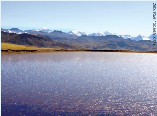
Laguna de la Provincia Bautista Saavedra - La Paz