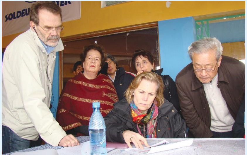
Ministra de Medio Ambiente de Suecia (Gunilla Carlsson) observa el mapa del ex-nevado Chacaltaya

Los impactos de la retracción de los glaciares se evidenciarían en las actividades pecuarias de la zona, mediante: la reducción de rentabilidad de los productos cárnicos y de la producción lechera, la pérdida